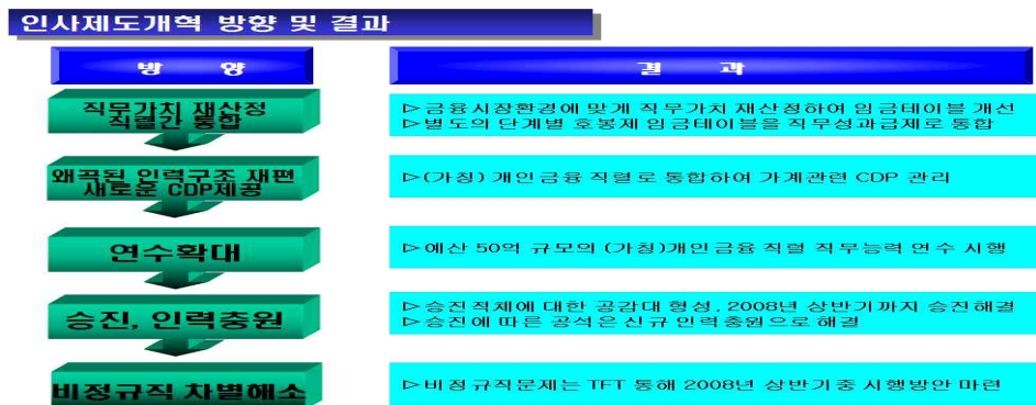
[그림 2-1] 2007년도 인사제도 컨설팅 요약

국내외 금융시장 환경에 맞게 직무가치를 재산정하고 임금테이블을 개선하고자 별도의 단계별 호봉제 임금테이블을 직무성과급제로 통합운용 할 수 있도록 2007년 1차 컨설팅을 수행한 결과로 직무를 구분하고 직원별 경력개발경로(Career Development Path)를 관리하고 왜곡된 인력구조 재편을 통해 새로운 CDP 제공 하였다. 이와 동시에 직무구분에 따른 능력향상을 위한 연수 사내외 연수 확대 실시를 강화하고 있다.