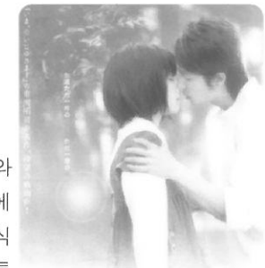
ただ、君を愛してる